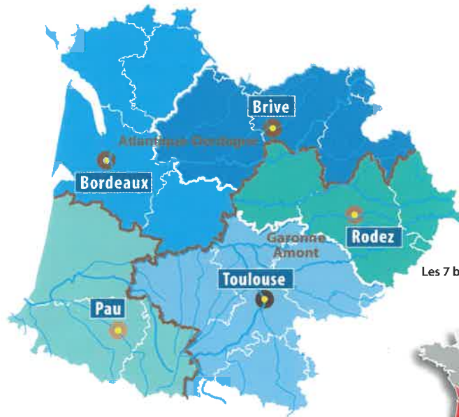
Les 7 bassins hydrographiques métropolitains

90 rue du Férétra - CS 87801 31078 Toulouse Cedex 4 Tél. : 05 61 36 37 38 | Fax : 05 61 36 37 28